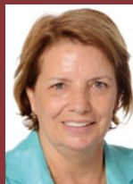
Ilda FIGUEIREDO (PT) Coordenadora do GUE/NGL