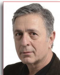
Stelios Kouloglou Αναπληρωτής