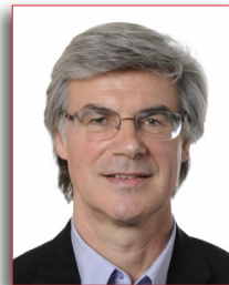
Patrick Le Hyaric Αναπληρωτής