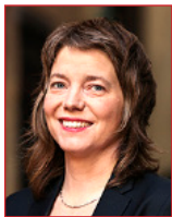
Malin Björk (Σουηδία) συντονίστρια της Ομάδας GUE/NGL FEMM