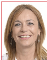
Ángela Vallina (Espagne) membre de la commission FEMM