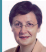
Bairbre DE BRÚN* (IE)