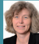
Sabine WILS* (DE)