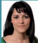
Marisa MATIAS* (PT)