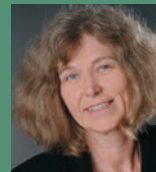
Sabine WILS (DE)