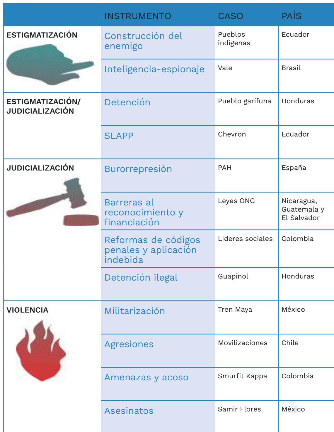
TABLA 1. Criminalización del derecho a la protesta: instrumentos y casos.