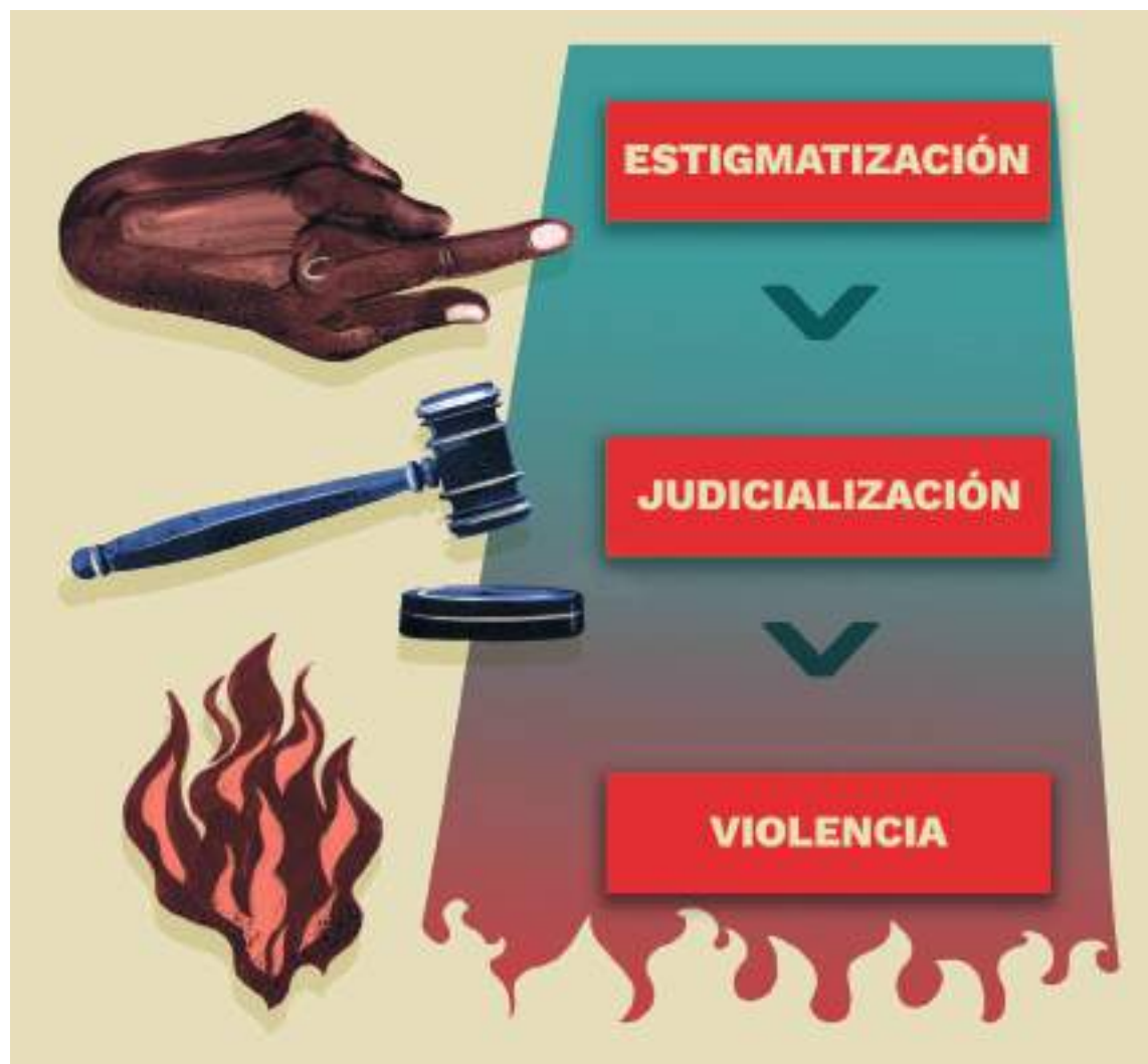
CUADRO 5. Criminalización del derecho a la protesta: instrumentos