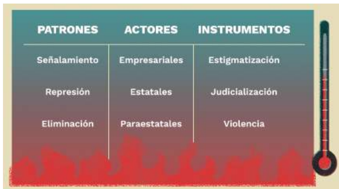
CUADRO 1. Criminalización del derecho a la protesta: marco teórico.