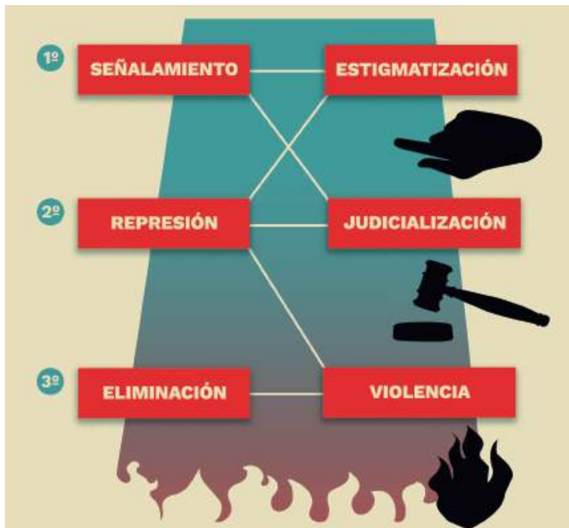
CUADRO 4. Criminalización del derecho a la protesta: patrones e instrumentos.